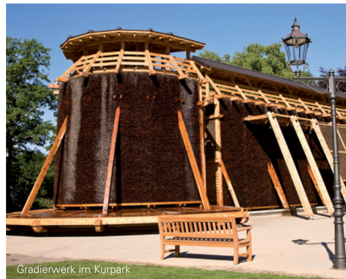
Gradierwerk im Kurpark

Die aktuellen Preise finden Sie im Internet: www.stadtwerke-hamm.de